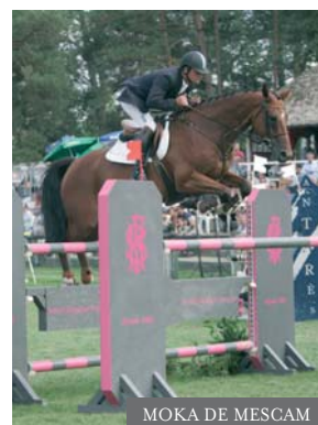
MOKA DE MESCAM

1er : KELLEMOI DE PEPITA (SF) par Voltaire (HAN) x Jalmé des Menuls (SF), participe au circuit à 6 ans / Michel Robert 7ème : ITOT DU CHATEAU (SF) par Le Tot de Semilly (SF) x Galoubet A (SF), Très Bon à 6 ans / Edwina Alexander (AUS)